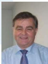
Georges MAZUYER M.V.A. CABINET