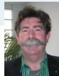
Gérard PICART STUDIO QUICK