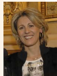
Dany MORSILLI LYON SCENE PRODUCTIONS