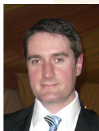
Emmanuel MORATO LYON SCENE PRODUCTIONS