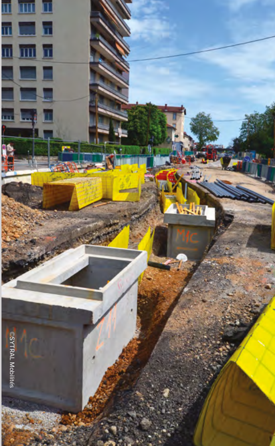
Travaux en cours sur la route de Genas